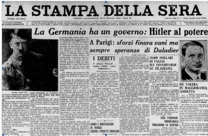
1933: Hitler diventa cancelliere del Reich