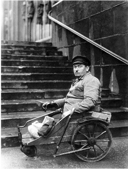
Un invalido tedesco reduce della prima guerra mondiale