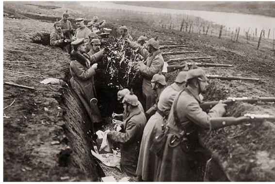
Soldati tedeschi in trincea