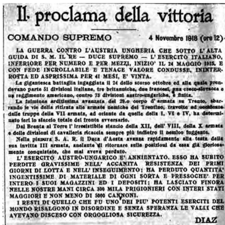
L'annuncio della vittoria dell'esercito italiano da parte del generale Armando Diaz