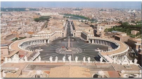
Gian Lorenzo Bernini, Colonnato di San Pietro

Fra i più importanti artisti di questo periodo ricordiamo l'architetto e scultore Gian Lorenzo Bernini e il pittore Michelangelo Merisi detto Caravaggio .