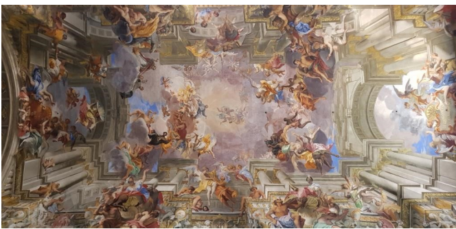
Andrea Pozzo, Gloria di Sant'Ignazio