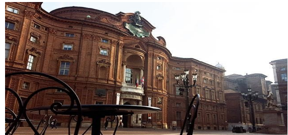
Guarino Guarini, Palazzo Carignano