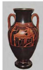
vaso con figure rosse

Capitello: Il capitello ionico ha una decorazione a spirale