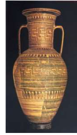
Vaso stile geometrico

Il periodo del Medioevo Ellenico : verso il 1150 a.C., dopo la guerra di Troia (vinta dagli Achei) i Dori , popolazione di pastori conquistano la Grecia. Scompare la scrittura, il commercio, la scultura, la pittura. Uniche forme d'arte sono le ceramiche dipinte nel cosiddetto stile "geometrico".