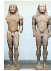
statue di ragazzi