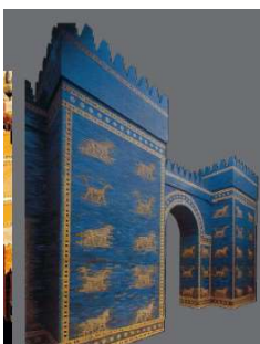
Porta di Ishtar

Al regno babilonese risale anche la costruzione delle splendide mura della città di Babilonia , spesse da 6 a 24 metri. Nella doppia cintura della si aprono 9 monumentali porte. Ne sono state scoperte 4, la più importante è la porta dedicata alla dea Ishtar (dea della fecondità). Era rivestita di mattoni smaltati e decorata con bassorilievi raffiguranti tori, leoni e draghi.