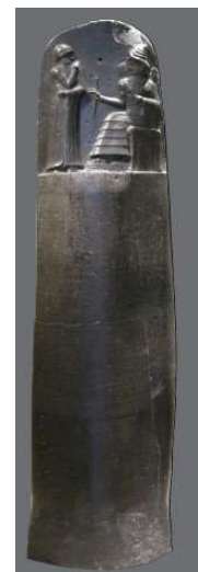
Stele di Hammurabi