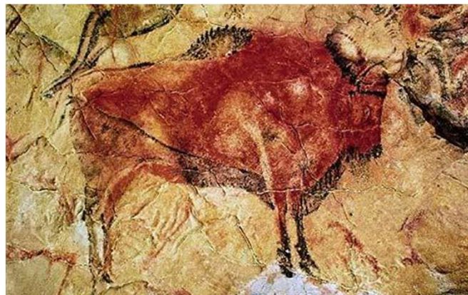
Pittura rupestre di Altamira

Oggi possiamo ammirare numerose pitture rupestri in vari luoghi ad esempio in Spagna ad Altamira, in Francia a Lascaux e in Italia in Val Camonica (Lombardia) .